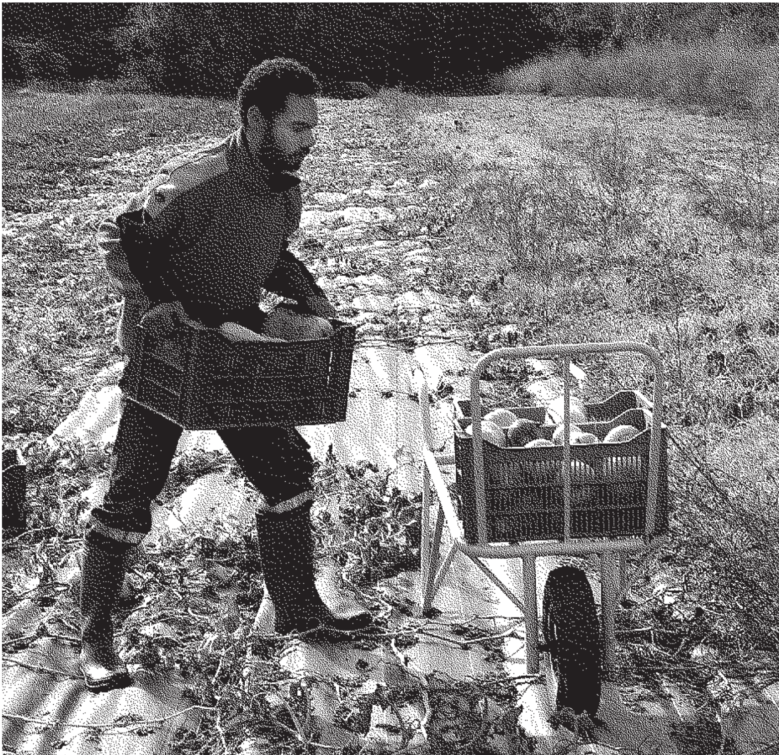
Le maraîcher c'est : La ferme collective la Clef des sables, en Isère.