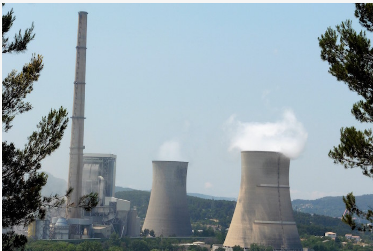
La centrale thermique de Provence, à Gardanne (Bouches-du-Rhône).

Dans les tuyaux depuis 2012, l'unité à biomasse de la centrale thermique de Provence aurait dû commencer sa production d'électricité fin 2014. Uniper, ancienne filiale d'E.ON, prévoit d'y brûler 850.000 tonnes de bois par an. Un gâchis environnemental selon de nombreux élus locaux, collectifs et associations écologistes, qui s'inquiètent de l'effet d'entraînement qu'aura cette usine sur « l'industrialisation de la forêt ». Localement, ce sont les nuisances sonores, les pollutions à cause des particules fines, des rotations de camion et des cendres qui sont critiquées.