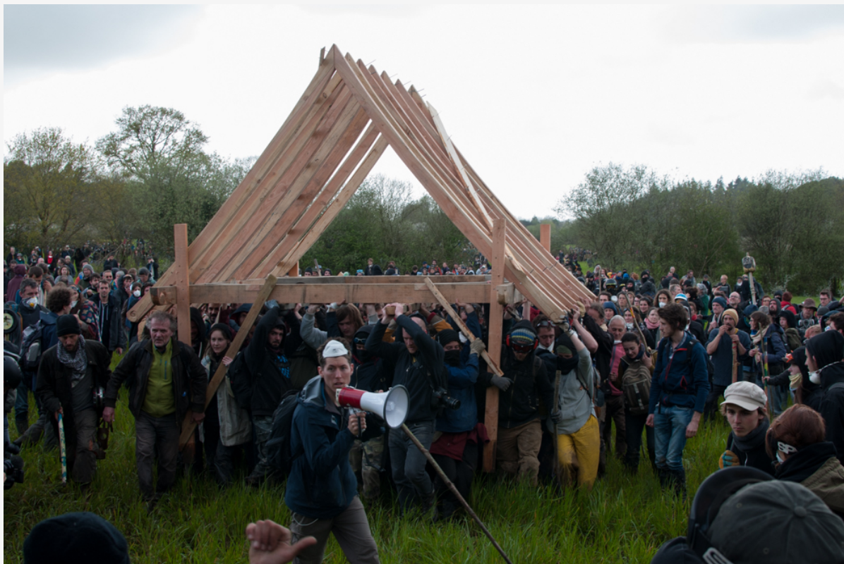
Le transport de la charpente du nouveau Gourbi, le 15 avril.

Ce commun-là est notre force, il est ce pour quoi nous nous battons ici, ce pour quoi nous nous battons encore très bientôt. Il est ce à quoi nous devons être fidèles, quelle que soit notre situation administrative. Mais il n'est rien sans un territoire. Il est aussi géographique qu'historique, ancré dans ce bout de bocage jusqu'au bout des ongles. Il n'y a pas de commun en soi sans les moyens de sa réalisation, sans les lieux d'organisation qui lui donnent toute son amplitude. Ce commun-là ne se transporte pas plus ailleurs que les animaux menacés qu'ils voulaient « déplacer ». Il appartient à ce territoire-là, il est enfant de ce mouvement-là, il est son héritage autant que son présent, en actes. C'est pour cela que nous luttons contre l'anéantissement de la Zad, parce que ce qui vit ici ne vivrait pas ailleurs. Parce qu'il n'existe en France aucun autre endroit partagé réellement par tout un mouvement de lutte, par des milliers de personnes ayant traversé ensemble des batailles, des espoirs, des désillusions, et y ayant survécu. Tant que cette lueur éclairera les talus et les fossés du bocage, nous combattons pour elle.