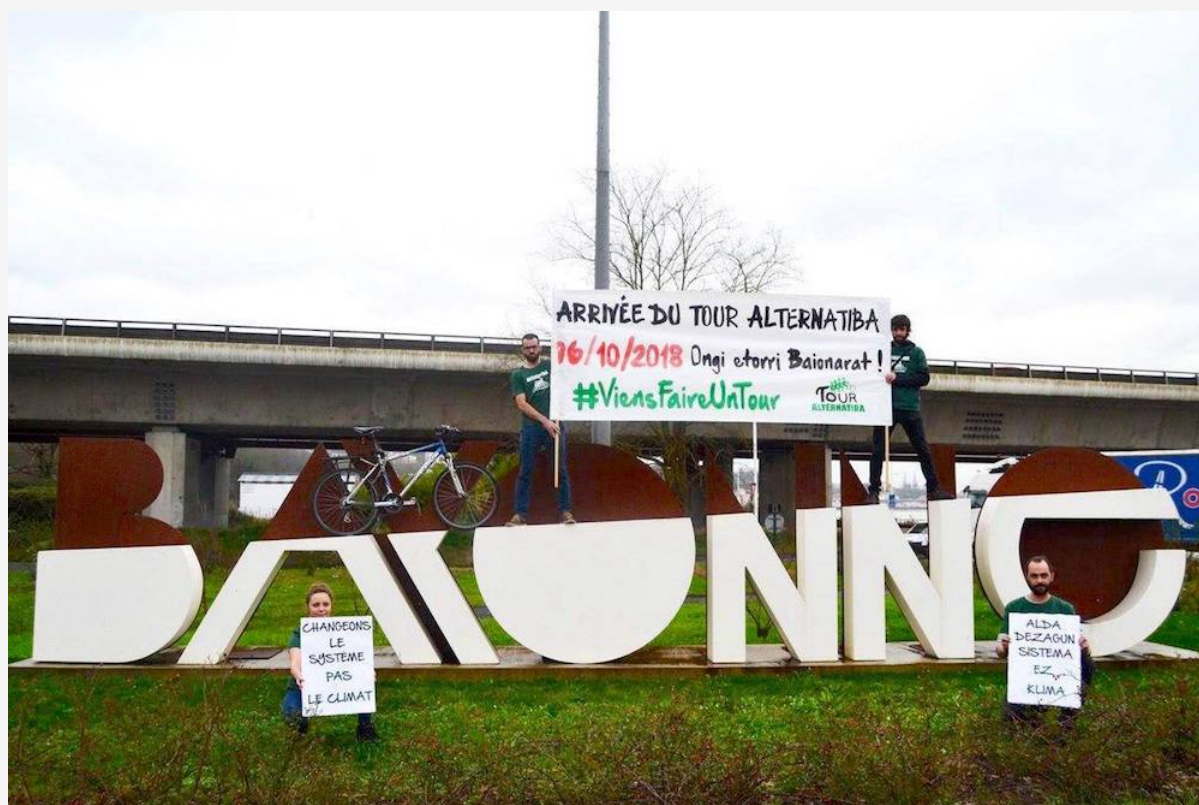
Le Tour 2018 se terminera à Bayonne, dans les Pyrénées-Atlantiques.

quinzaine de nouveaux villages des alternatives.