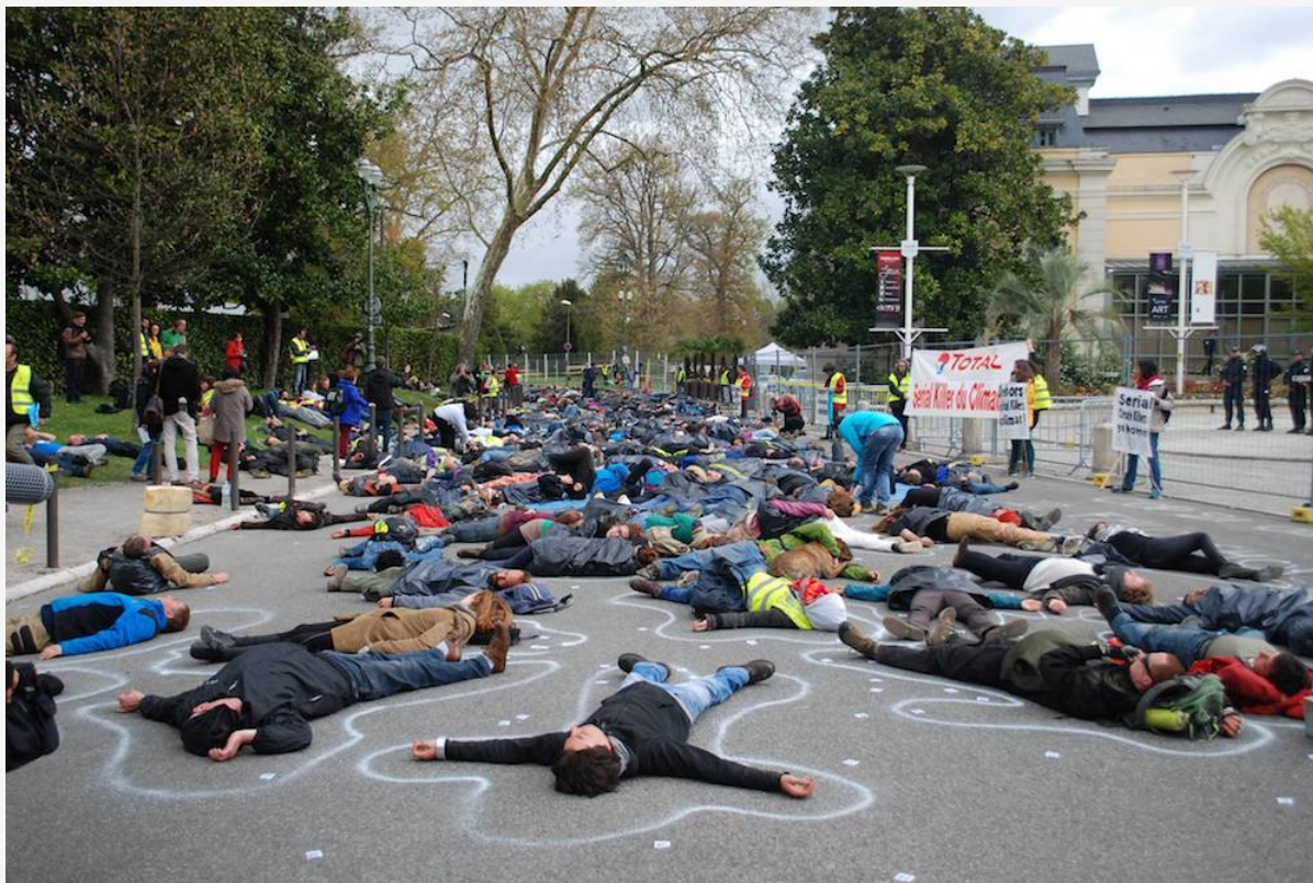
Une action non violente lors du sommet des pétroliers à Pau, en avril 2016.