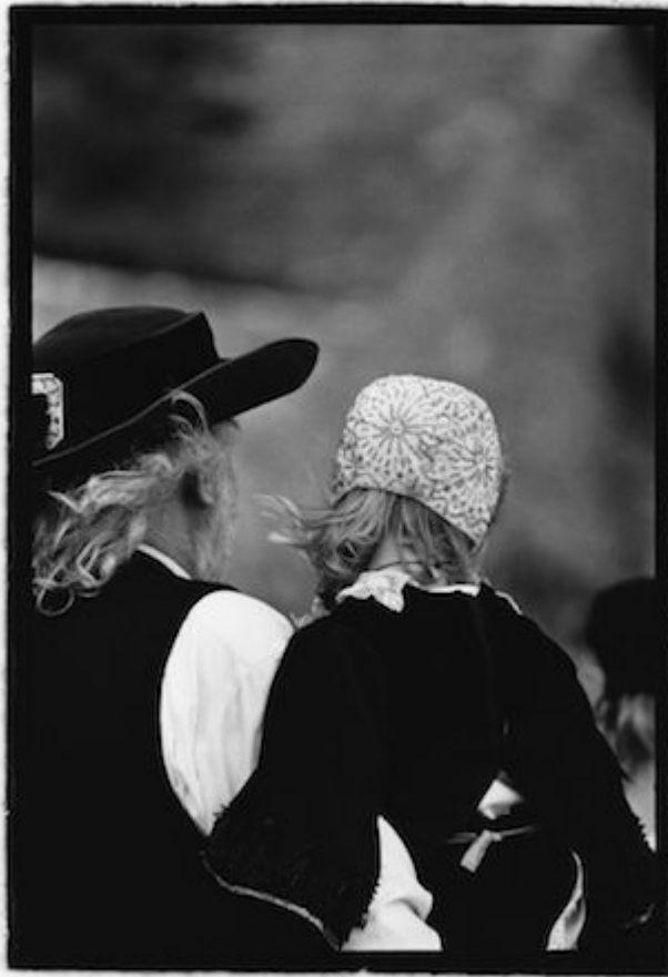
À l'extrême pointe du Finistère, la fête traditionnelle du pain à Keriolet, 2012.