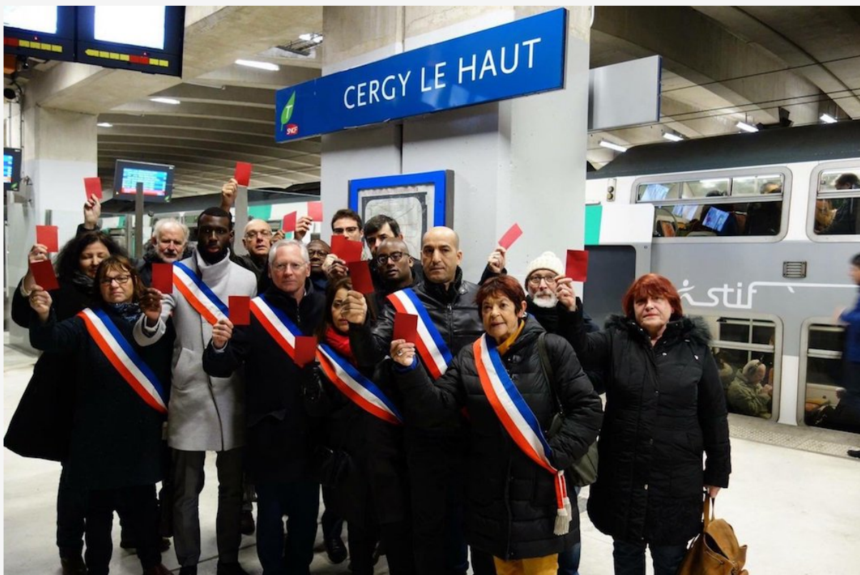
Des élus de Cergy et des usagers du RER B ont brandi, jeudi 7 février, un carton rouge contre la décision de l'État de privilégier le CDG Express.