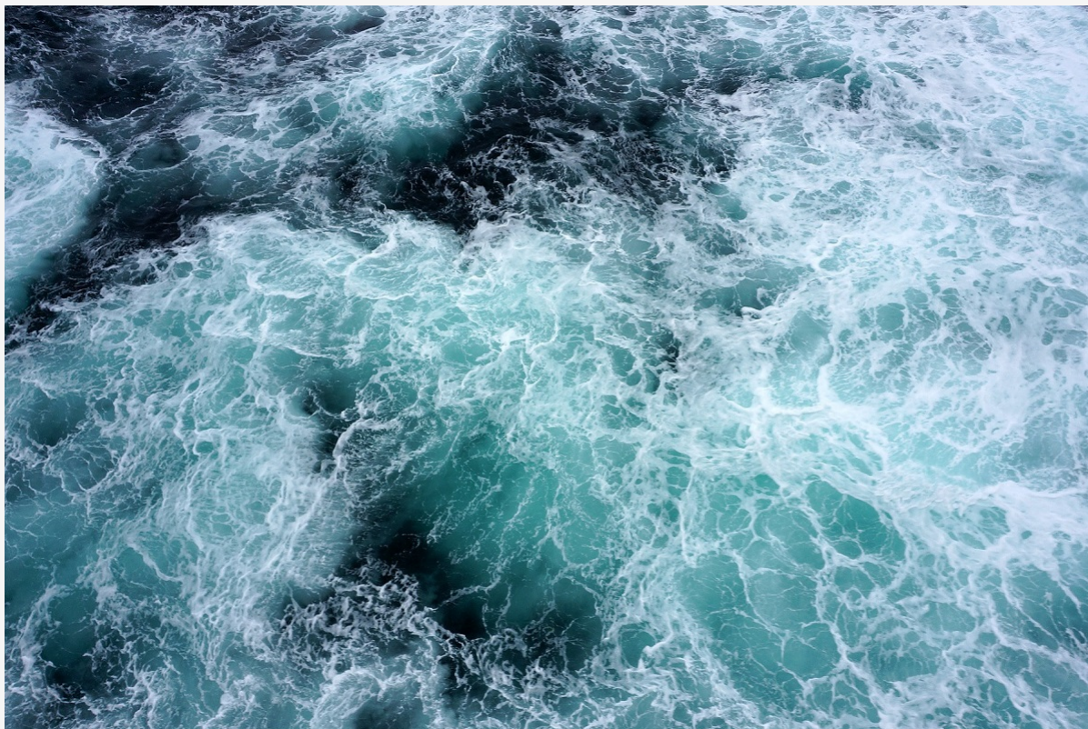
Le manque d'oxygène causé par le changement climatique touche surtout la haute mer.

De plus, la chercheuse du CNRS estime que les scientifiques ne possèdent pas les moyens suffisants pour mener à bien des études précises : « Il nous manque de l'argent pour faire des campagnes, avoir plus de mesures d'oxygène dissous partout dans les océans, acheter des capteurs à mettre à l'eau... Pour voir ce qui se passe dans la durée, il faut une observation pérenne et régulière. Il y a une telle variabilité sur ces processus que ce ne sont pas quatre points de mesures qui vont raconter une histoire. Il faut vraiment qu'on puisse capter toute la tendance. »