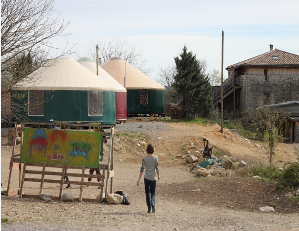
Les yourtes de l'école du Hameau des buis

Il faut se mettre en transition, c'est une opportunité de changer le monde. Cela veut dire construire des « réseaux des temps difficiles ». C'est retrouver le lien aux autres, à la nature, avec nous-mêmes. C'est accepter l'interdépendance de tous les êtres. Quand une civilisation s'effondre, les bâtiments peuvent s'effondrer, il reste les liens humains.