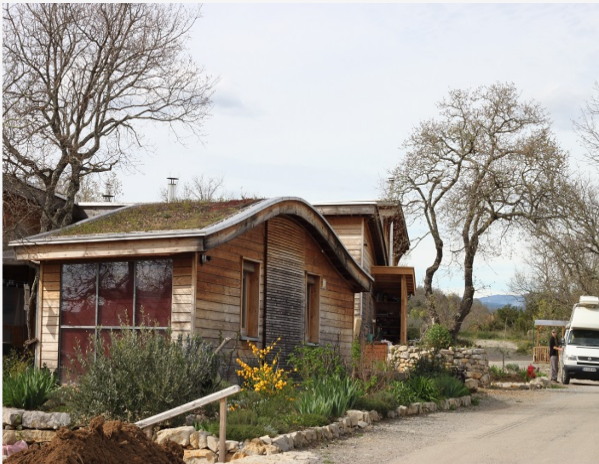
Des maisons au Hameau des buis

On a creusé cette question en partant de ce qui était vulnérable. Aujourd'hui dans nos sociétés, on a une économie, des lignes d'approvisionnement, un système financier, des structures de flux – tout ce qui est système alimentaire, système d'approvisionnement en eau, système médical. Tout cela est devenu extrêmement fragile parce que complexe, inter-connecté. Donc ce qui va s'effondrer, c'est tout ce qui dépend des énergies fossiles. Cela inclut les énergies renouvelables et le nucléaire, car pour les fabriquer, il faut des énergies fossiles. Quand on se rend compte que quasiment toute notre nourriture dépend du pétrole, qu'est-ce qu'on va manger ? Ce qui va s'effondrer est absolument gigantesque.