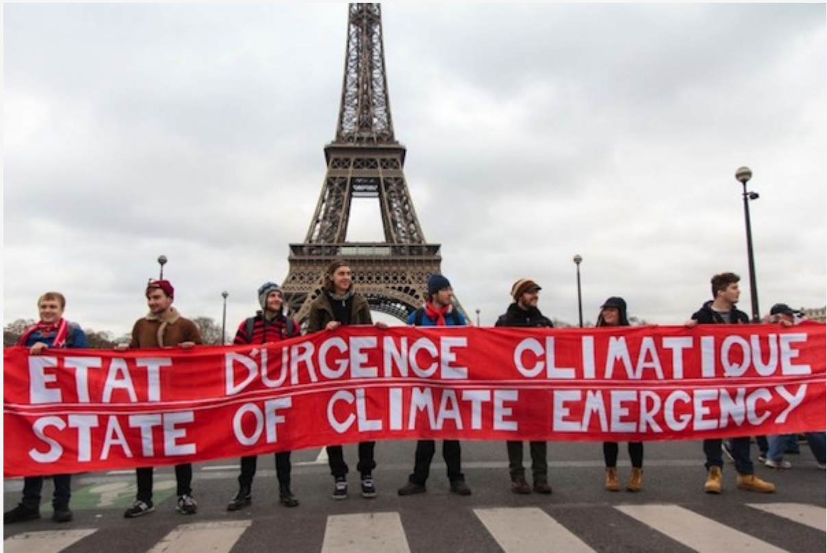
Lors de la manifestation pour le climat le 12 décembre 2015