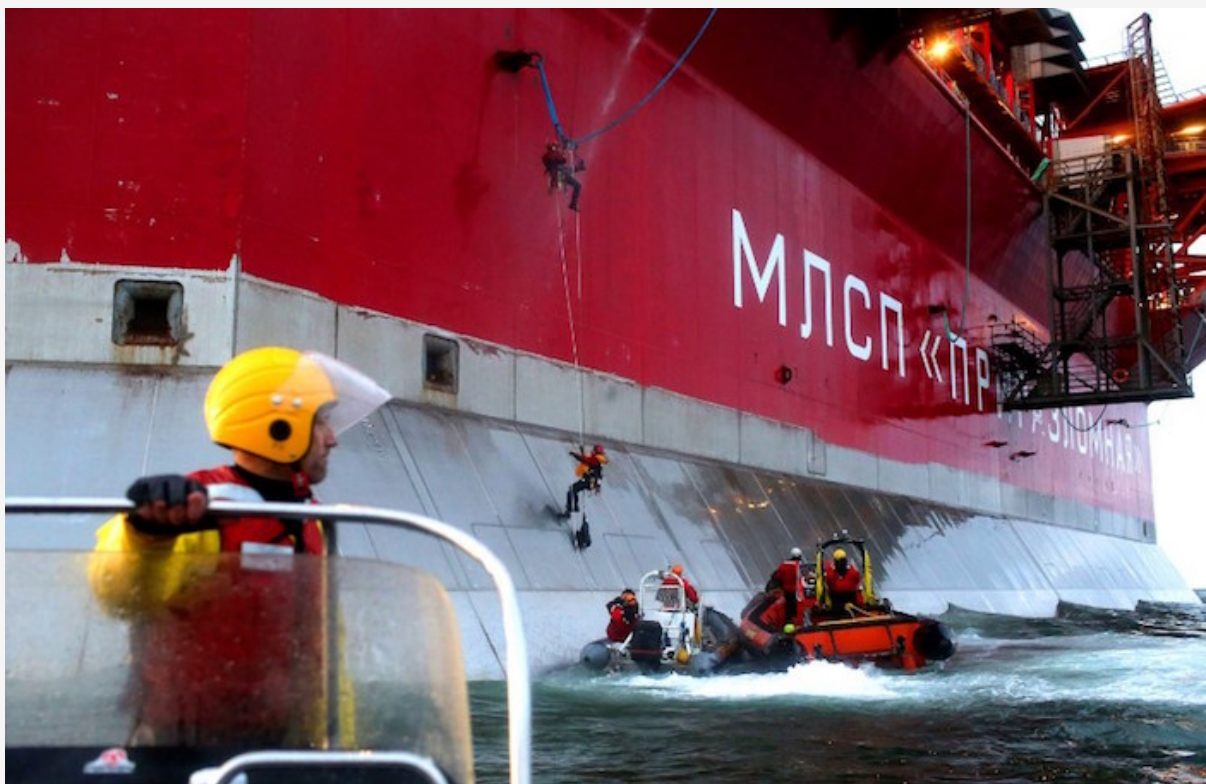
L'action des militants de Greenpeace contre la plate-forme russe de Prirazlomnoye en septembre 2013.

Pourtant, Total s'était engagé en 2012, par les déclarations de son PDG d'alors, Christophe de Margerie , à ne pas explorer ni exploiter en mer Arctique. Son argument : le risque environnemental serait trop élevé. Faut-il déduire de cette stratégie que le risque environnemental est tolérable tant qu'il est supporté par quelqu'un d'autre ?